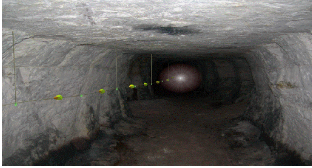
Şekil-1: Hayat hattı görünümü

18.1. Hayat hatlarının acil durumlarda kullanımına ilişkin, çalışanlarda davranış değişikliği sağlayacak şekilde eğitimler verilir.